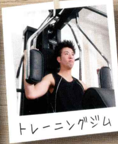
トレーニングジム